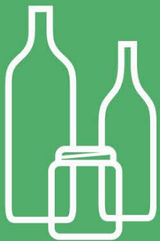
WINE BOTTLES, BEER BOTTLES & GLASS JARS