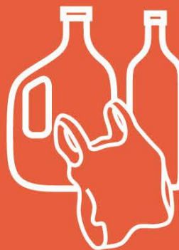
PLASTIC BAGS, PLASTIC CONTAINERS & BOTTLES