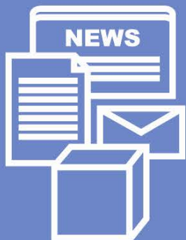
NEWSPAPERS, MAGAZINES, BOOKS & PAPER PACKAGING