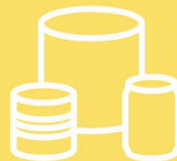
METAL CONTAINERS & CANS